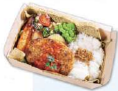
本日のハンバーググリル