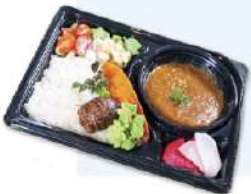
自家製吹風 ビーフカレー