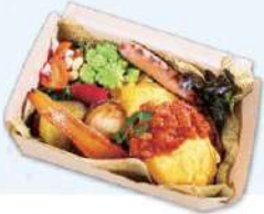
大人のトロ卵オムライス お子様用に辛さ控えめも承ります