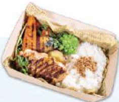
本日のチキングリル