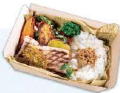
本日の四元豚グリル